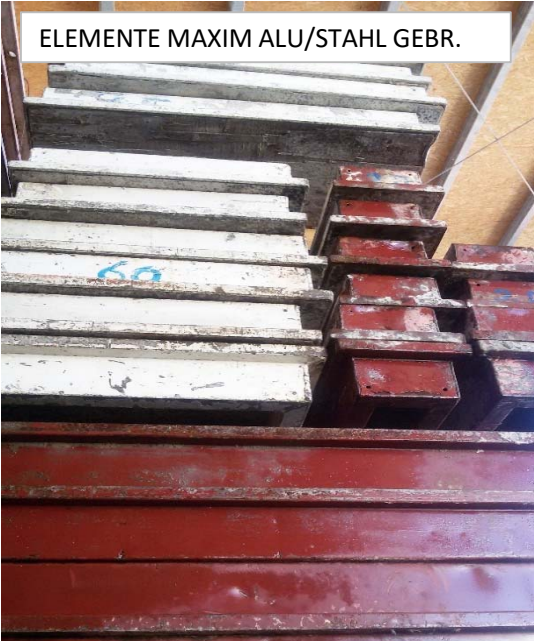
ELEMENTE MAXIM ALU/STAHL GEBR.