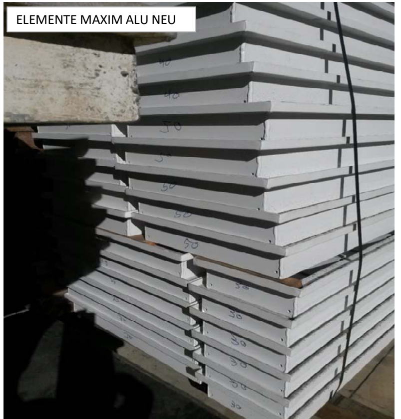
ELEMENTE MAXIM ALU NEU