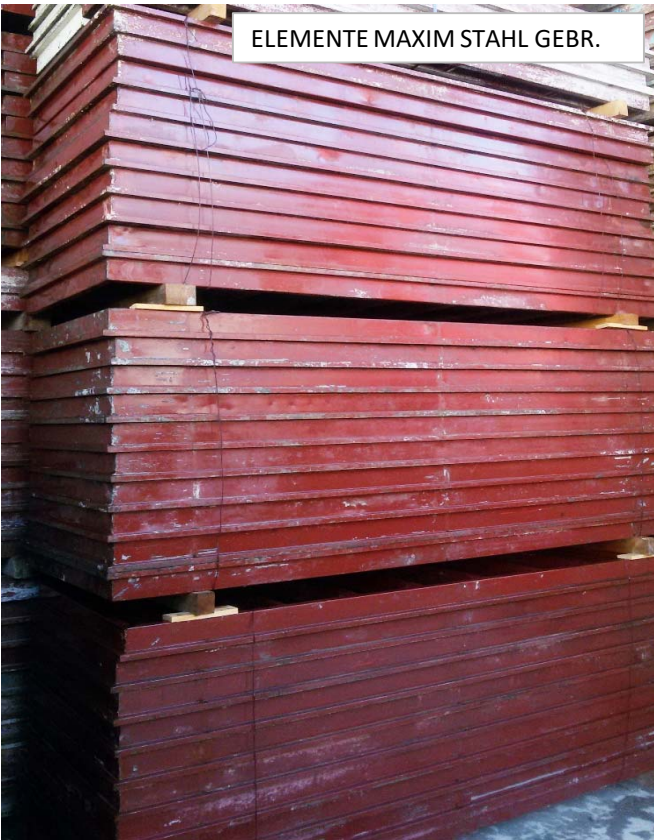
ELEMENTE MAXIM STAHL GEBR.